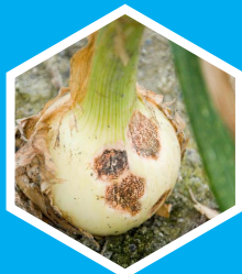
Anthracnose (ex. : Oignon)