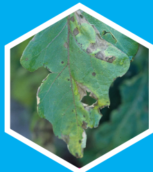
Alternariose (ex. : Aubergine)