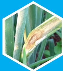
Stemphylium (ex. : Oignon)