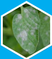
Oïdium (ex. : Tomate)